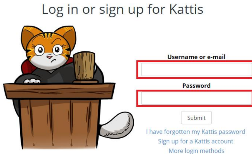
Hình 1. Hướng dẫn đăng nhập